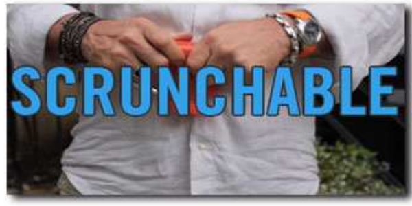
Kann zur Reinigung komplett umgestülpt werden